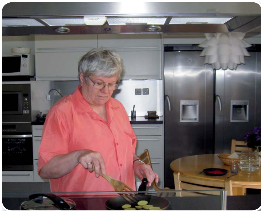
Spisens säkerhetsprodukter förbättrar säkerheten vid användningen av spisen i alla typer av hushåll.

De testade produkterna förebygger farosituationer och spisbränder genom att bryta ström till spisen utifrån tid, tid och spislattans effekt, temperatur, temperaturförändringar och rörelsesensorer eller rökutveckling. Om brytningen av strömmen baserar sig på tid samt tid och effekt, varierar de tider strömmen bryts efter mellan 5 min–5 h, beroende på spistyp